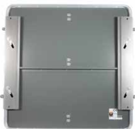
Riegel und Klappmechanismus