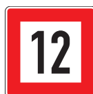
B. 6 Gebot die angegebene Geschwindigkeit gegenüber dem Ufer (in km/h) nicht zu überschreiten.

Abmessungen in mm 1050 x 1050 x 2 1450 x 1450 x 3 Ziffern nach Ihren Angaben.