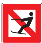
A. 14 Verbot des Wasserskilaufens

Abmessungen in mm 1050 x 1050 x 2 1450 x 1450 x 3