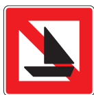
A. 15 Fahrverbot für Segelfahrzeuge

Abmessungen in mm 1050 x 1050 x 2 1450 x 1450 x 3