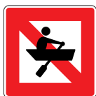
A. 16 Fahrverbot für Fahrzeuge, die weder mit Maschinenantrieb noch unter Segel fahren, außer DonauSchPV.

Abmessungen in mm 1050 x 1050 x 2 1450 x 1450 x 3