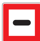
B. 5 Gebot unter bestimmten Bedingungen anzuhalten.

Abmessungen in mm 1050 x 1050 x 2 1450 x 1450 x 3